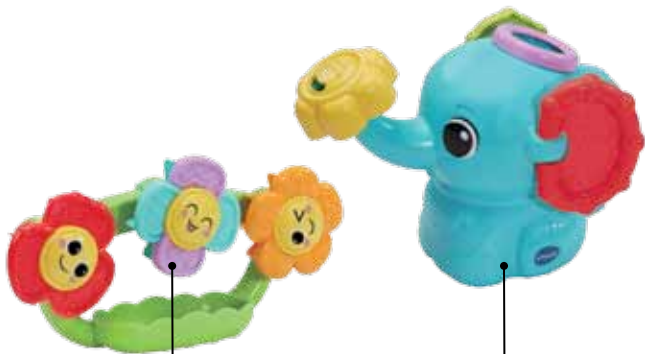
3 Flores giratorias

Cuando este divertido elefante inclina su trompa, observa cómo sale el agua y riega las coloridas flores que hay debajo. Disfruta viendo cómo las flores giran y dan vueltas con cada gota, ¡regar nunca había sido tan mágico!